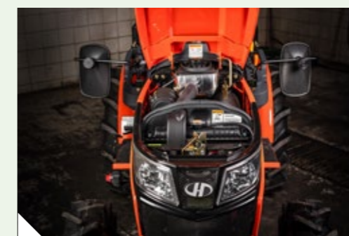
Arranjo Compacto da Área de Motor