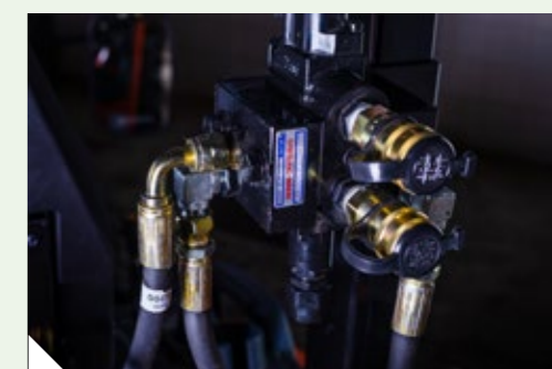
2 Distribuidores Hidráulicos Traseiros