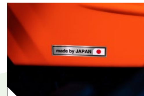
Made by Japan