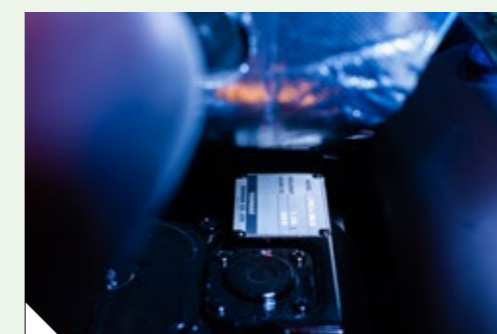
Conceituado Motor Yanmar