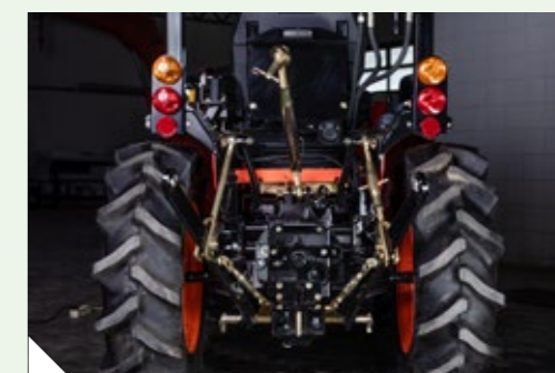
Capacidade de Elevação de 600kg