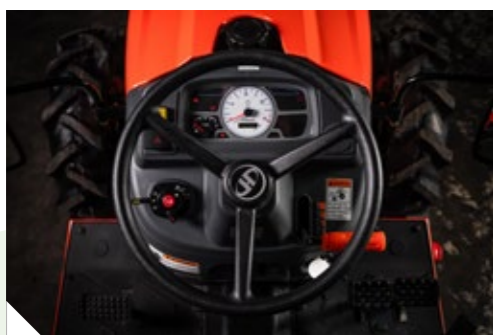
Instrumentos Modernos e Funcionais, Elevada Ergonomia