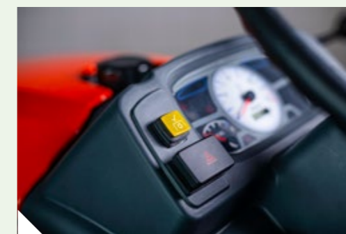
Accionamento Eletro-Hidráulico da TDF