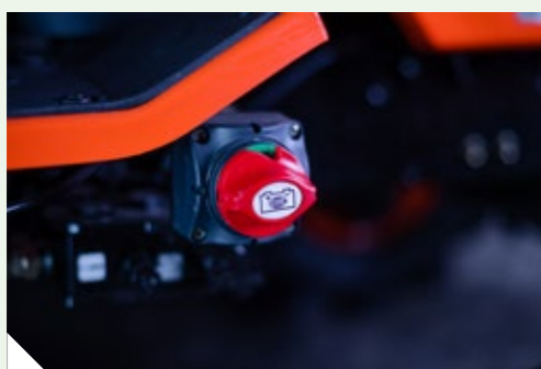
Corte de Corrente